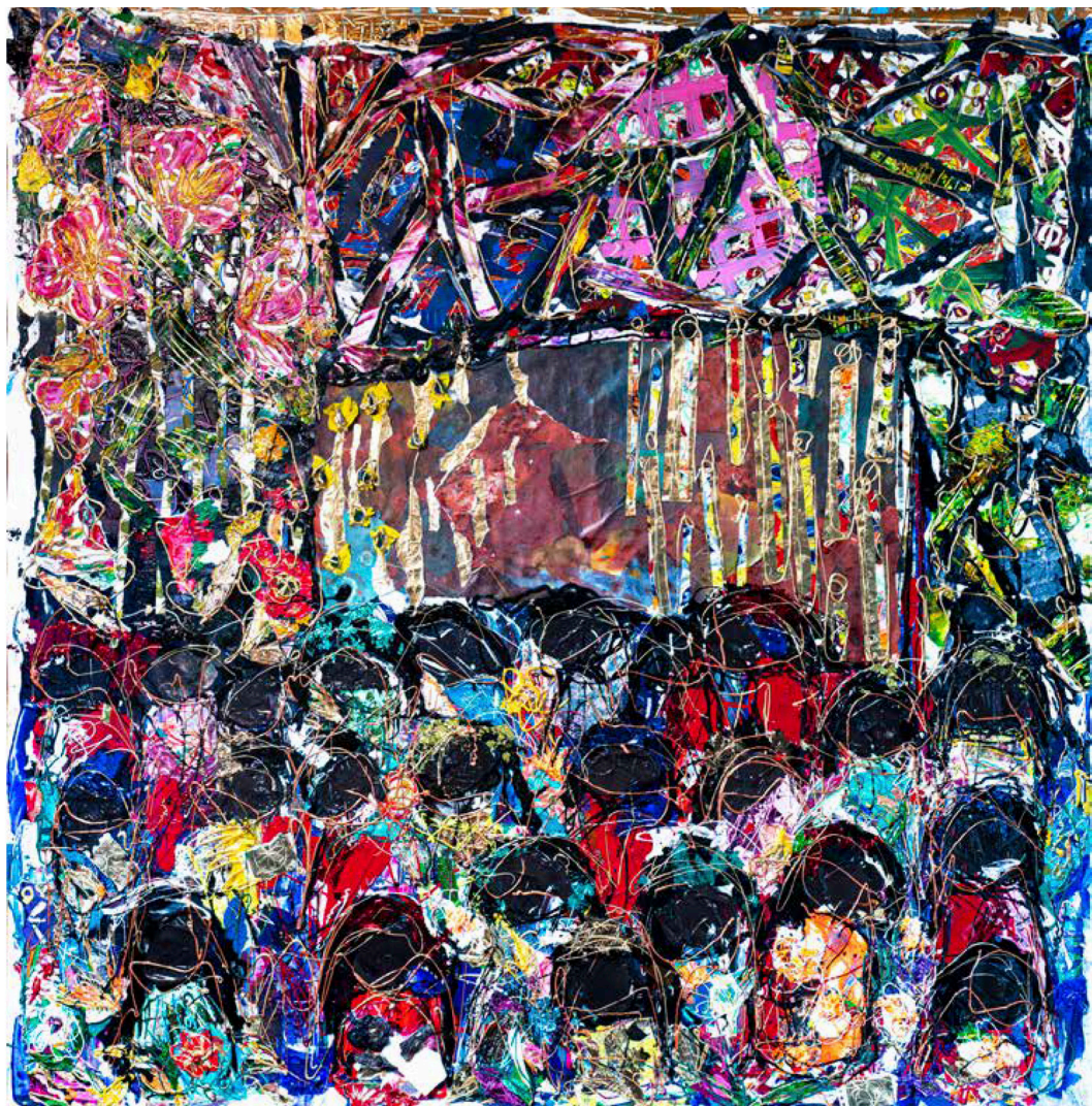
El anhelo de Salma. 150x150 cm. Técnica mixta sobre tela