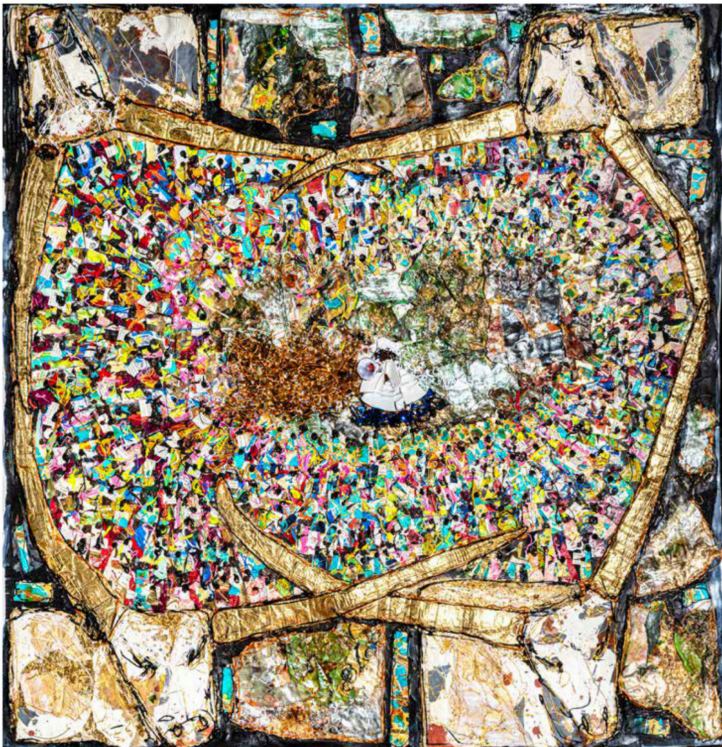
El grito de Amal. 150x150 cm. Técnica mixta sobre tela